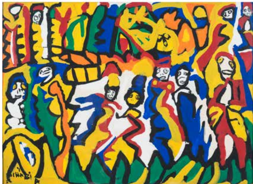
CHAÏBIA, sans titre , circa 1965

À travers un ensemble d'archives, de manuscrits, de textes, de documents inédits et d'œuvres, cette exposition met en lumière un aspect encore peu connu du parcours de Cérés Franco (1926-2021), galeriste, collectionneuse et, redécouvert récemment, poétesse, ainsi que des artistes Corneille (1922-2010) et Chaïbia (1929-2004), qu'elle a accompagnés et défendus. Plus resserrée autour des fonds conservés par le musée, l'exposition propose un corpus rare d'écrits et de créations, révélant la manière dont poésie et image se répondent, se prolongent et s'éclairent mutuellement.