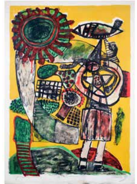
Corneille, La baigneuse au soleil, 1966

Cette sensibilité trouve un écho singulier dans sa relation avec Corneille, de son vrai nom Guillaume van Beverloo, ami fidèle et compagnon de pensée. Membre fondateur du groupe CoBrA, Corneille n'a cessé de dialoguer avec la poésie, illustrant de nombreux poètes, de Max-Pol Fouchet à André Laude, tout en développant sa propre pratique d'écriture. Artiste prolifique, il publie dans des revues et catalogues, et met en images plus d'une centaine de poèmes. Chez lui, le texte et la couleur participent d'un même élan d'invention libre.