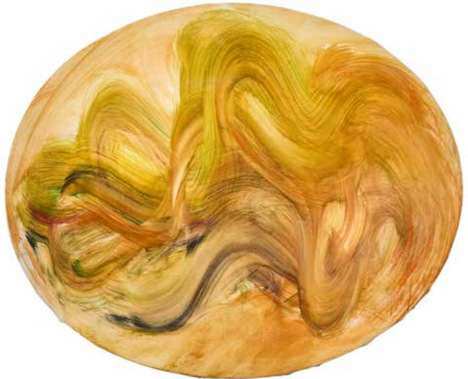
Jean Messagier, Sans titre dit aussi «Un été» , 1963, huile sur toile, collection privée © Alain Machéidon / La Coopérative-Musée Cérès Franco - ADAGP

En retraçant l'histoire des expositions de l'œil-de-bœuf, l'exposition met en lumière la manière dont Cérès Franco forge peu à peu son regard, affirme ses choix et construit un réseau international d'artistes. Elle montre aussi comment, de presque anecdote curatoriale, l'œil-de-bœuf devient un véritable objet théorique, à travers lequel se dessine une pensée du rapport entre forme et sujet, cadre et liberté, tradition et modernité.