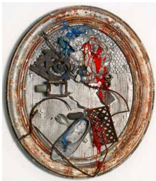
Niki de Saint Phalle, Tir au soulier , 1961, peinture, plâtre et objets divers sur bois, 77 x 66 x 18 cm © Niki Charitable Art Foundation / Adagp, Paris - Crédit photographique Muriel Anssens/Ville de Nice

Le premier, le plus patrimonial, replace l'aventure de l'œil-de-bœuf dans une histoire longue du format rond et ovale, depuis ses usages dans l'art savant et populaire jusqu'à ses résurgences dans l'art du XX e siècle. L'exposition présente notamment, dès les premières salles, un dialogue entre ex-voto, références aux avant-gardes et œuvres de figures majeures comme Sonia Delaunay , Georges Braque , Niki de Saint Phalle ou Paulo Leal , afin de restituer la singularité de la proposition formulée par Cérés Franco au début des années 1960. Ce premier ensemble permet de comprendre que le format de l'œil-de-bœuf n'est ni un simple effet décoratif, ni une curiosité formelle, mais un véritable opérateur de sens.