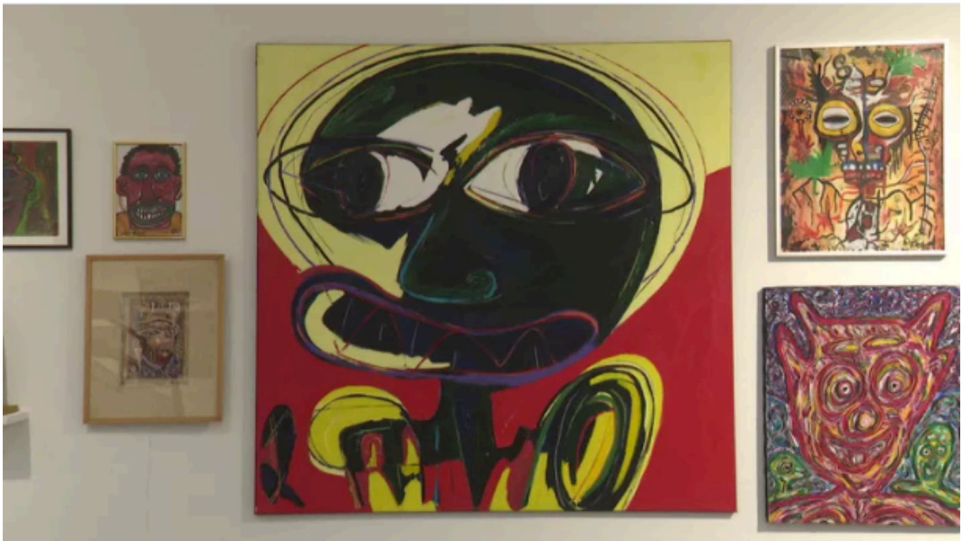
Cérès Franco : une passion pour l'art brut réunie dans le musée de Montolieu (Aude)