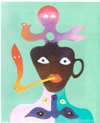
James Jack BROWN, Sans titre, 1974

Venues d'Europe, d'Asie ou bien encore d'Amérique latine, près de 280 œuvres vous sont présentées de manière ludique, grâce à un parcours de l'art naïf à l'art brut, en passant par l'expressionnisme et le surréalisme. Clin d'œil facétieux au chant révolutionnaire, le titre de l'exposition rappelle le caractère cosmopolite et éclectique de cette collection constituée par Cérés Franco. Tous les jours de 14h à 19h sauf le lundi, 5€/7€/2,5€ (enfants). Contact : La Coopérative, 04 68 76 12 54