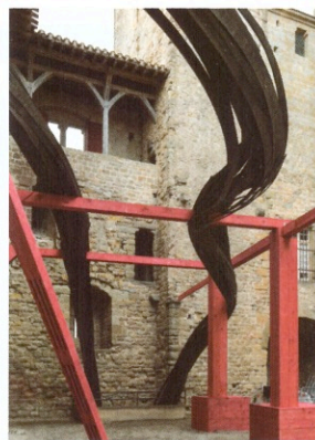
Rainer Gross, Pas perdus, 2017

Horaires et tarifs sur patrimoineetartcontemporain.com Contact : Le Passe Muraille, 04 67 06 96 04